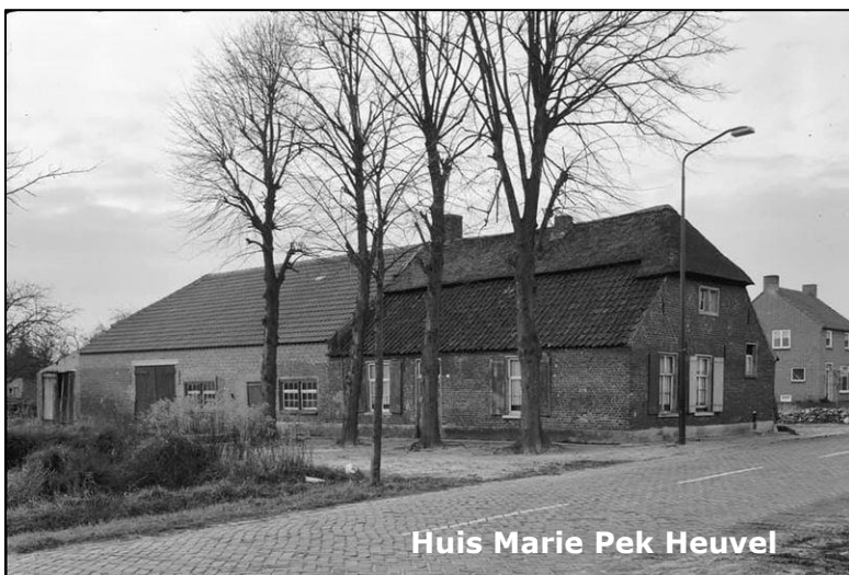
Huis Marie Pek Heuvel

Na een aantal jaren kochten we een ander huis, ook daar