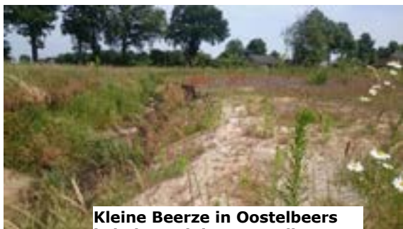
Kleine Beerze in Oostelbeers is helemaal drooggevallen.

Extreme droge en natte perioden zullen vaker voorkomen en lopen niet in de pas met het groeiseizoen van gewassen op het land en de behoefte aan water in de natuur. Het is daarom belangrijk dat er